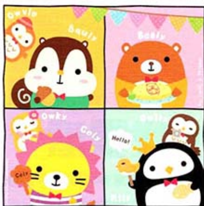
Squly &amp; Friends 嶄露頭角。