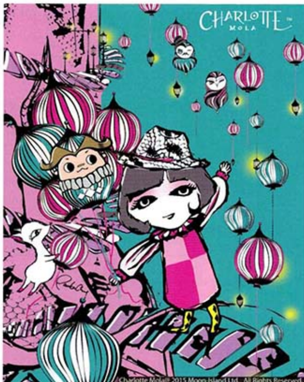
Charlotte MOLA X MINE仔