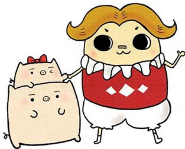
別別豬 X MINE仔