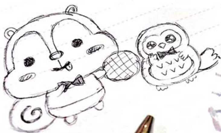
Squly &amp; Friends 線條簡單。