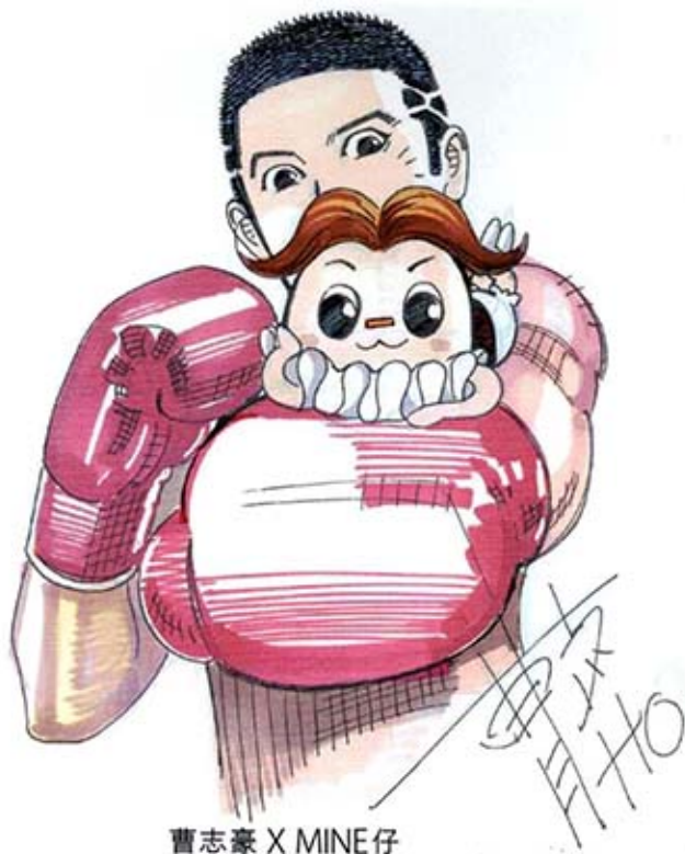
曹志豪 X MINE仔