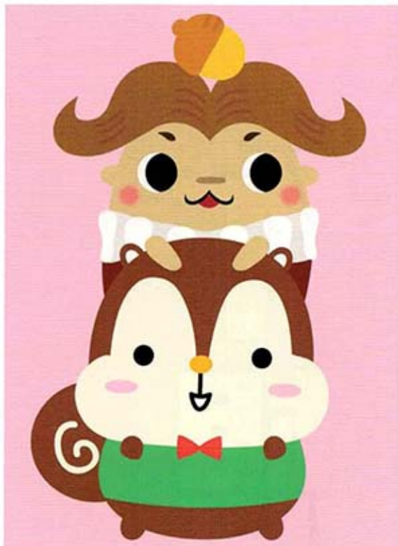
Squly &amp; Friends X MINE仔